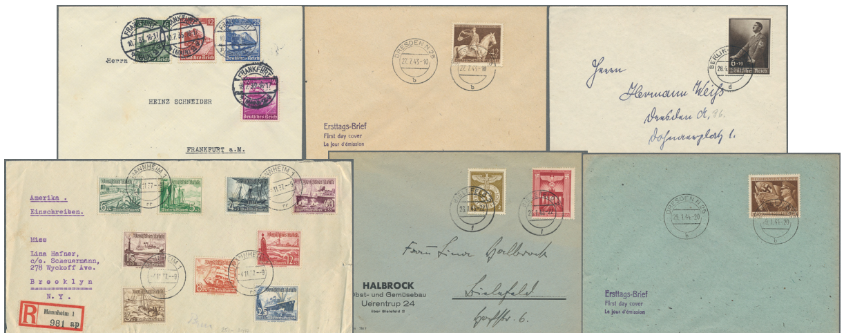
ex Los 3323