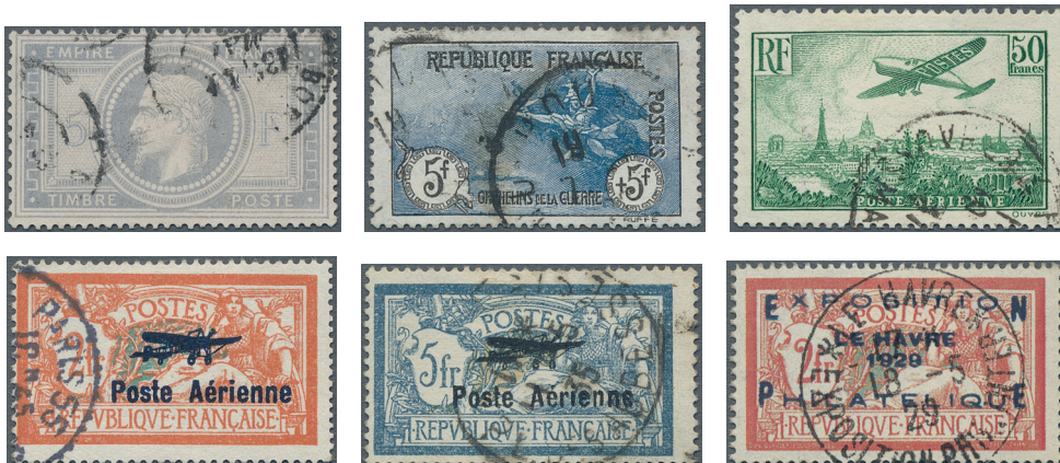
ex Los 3632