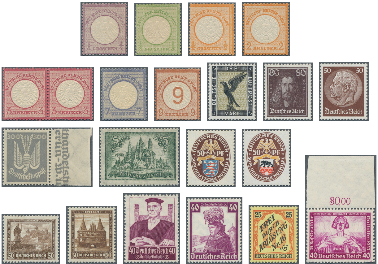
ex Los 3264