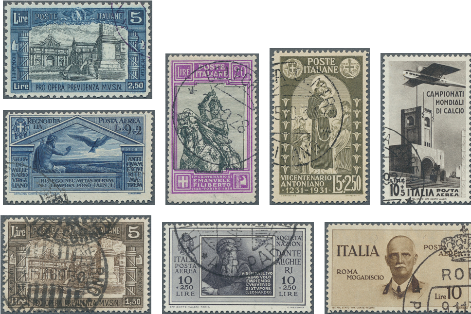
ex Los 3670