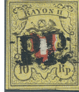
ex Los 3750