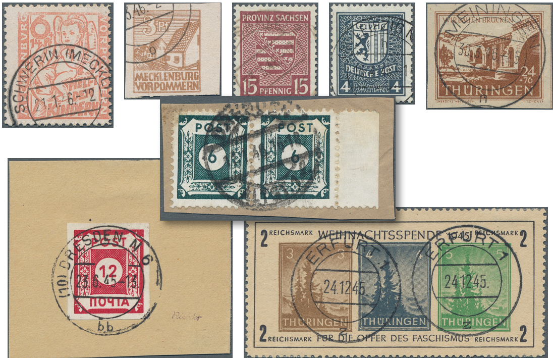
ex Los 3413