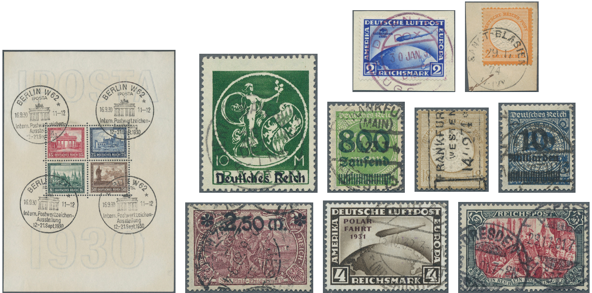
ex Los 3263