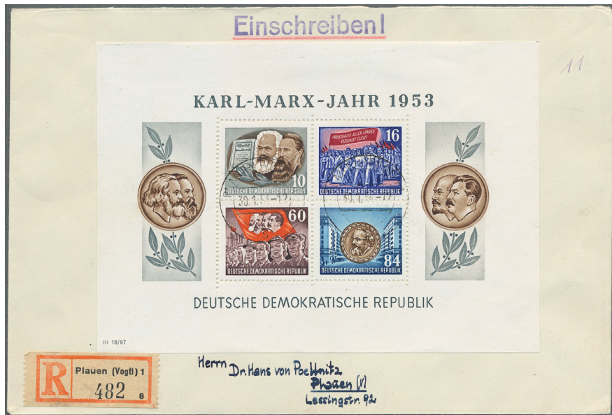
ex Los 3461