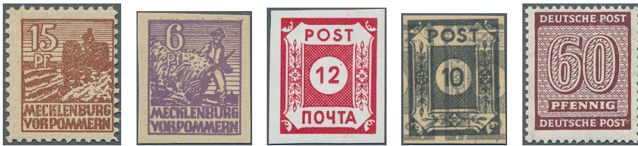
ex Los 3412