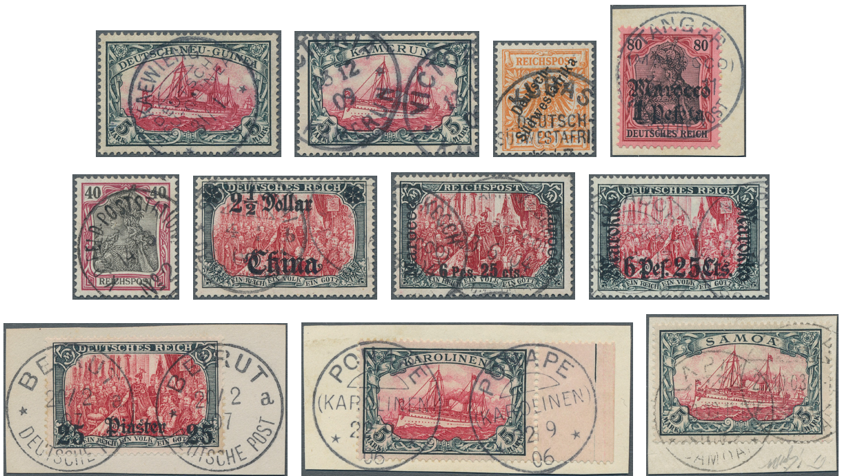
ex Los 3337