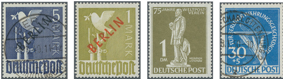
ex Los 3482