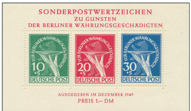
ex Los 3481