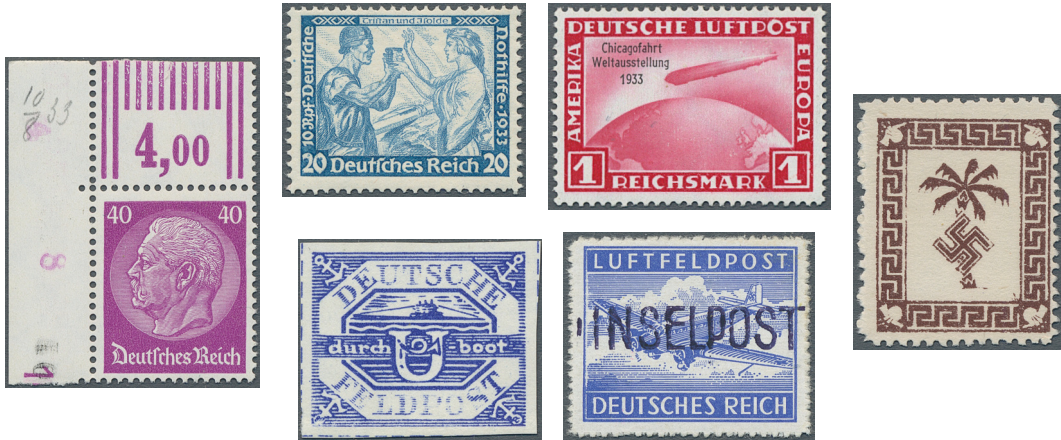
ex Los 3317