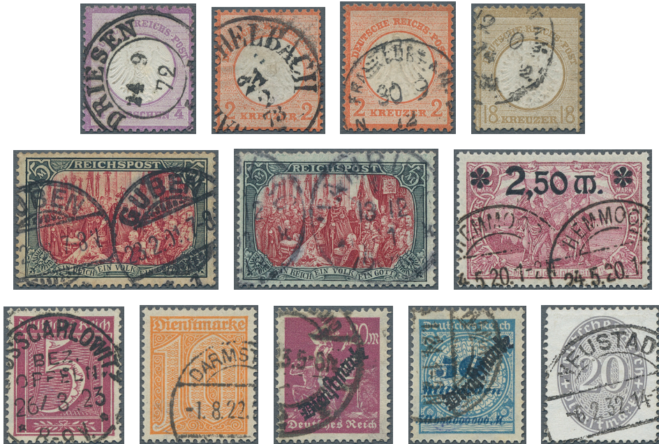
ex Los 3266