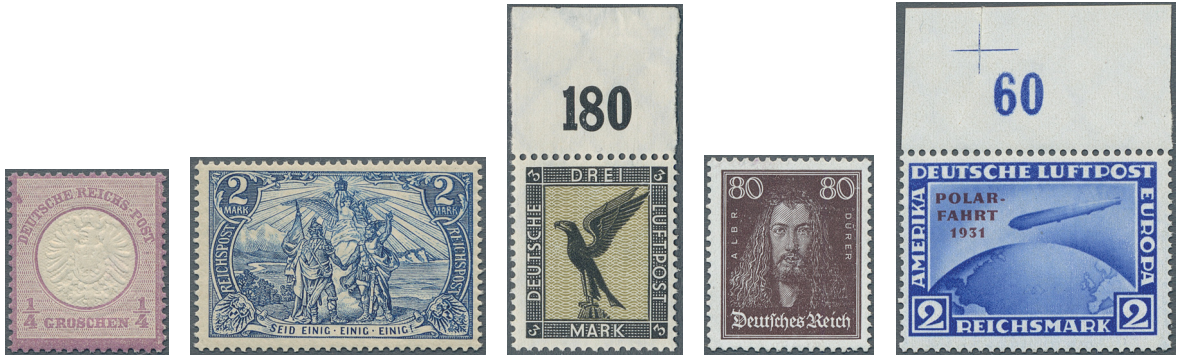
ex Los 3265