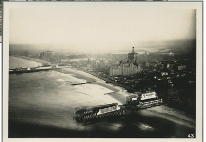
ex Los 3876