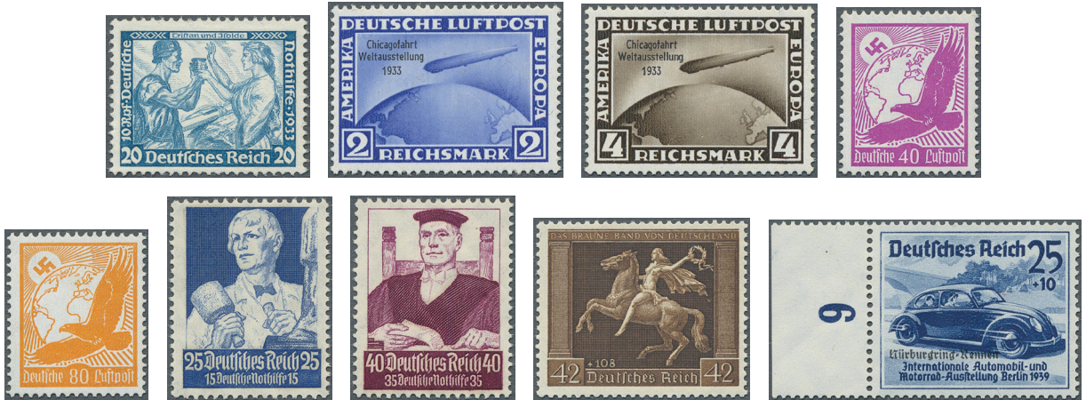
ex Los 3321