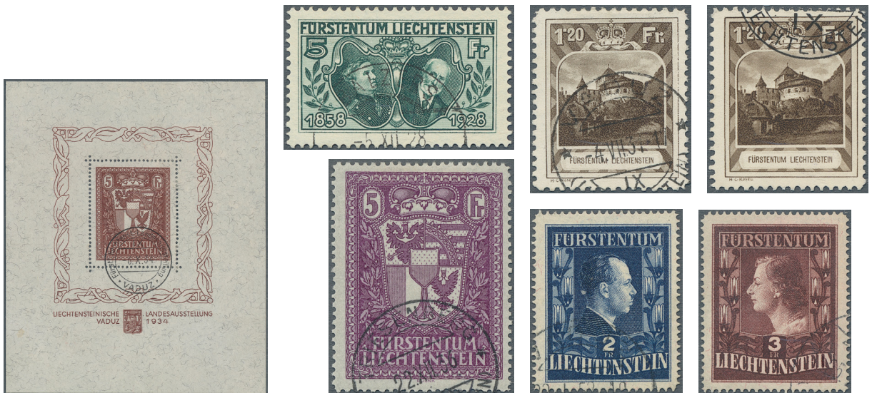
ex Los 3681